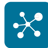
Arquitetura Estrelar de rede